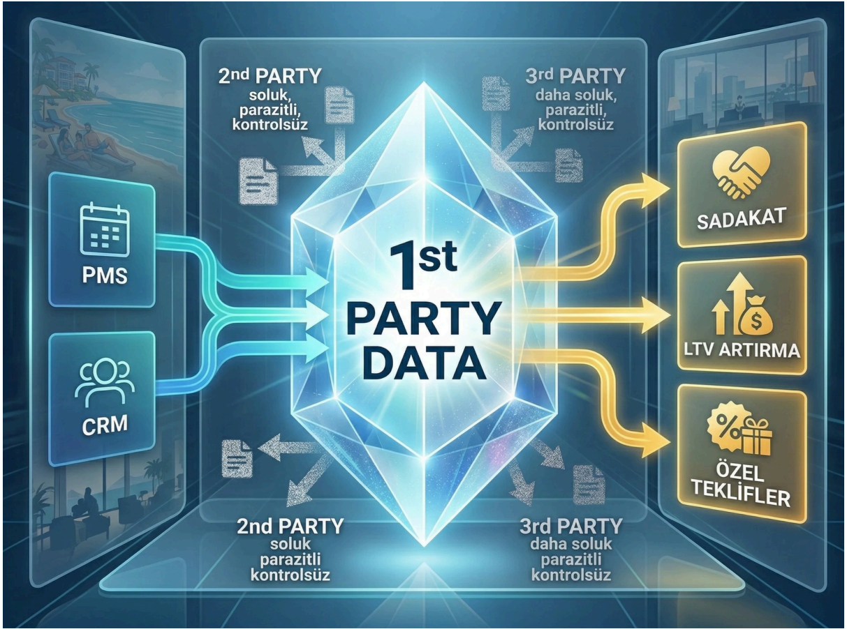
"Otelcilik için kritik misafir segment setlerini (Sadakat/LTV odaklı) gösteren konsept tablo görseli."