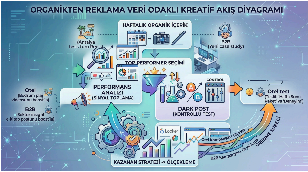
[Diagram / Flow]

Organik sosyal medya hesaplarında paylaşılan bir içeriğin performans sinyalleriyle reklam panosuna taşınma köprüsünü gösteren; gelen organik etkileşimlerin (kaydetme, paylaşım, yorum) skora filtrelerinden geçişini, 6 puan üzeri içeriklerin stratejik kontrol ve UTM ihtiyacına göre "Boost" (mevcut kitleyi ve kanıtı büyütme) veya "Dark Post" (izole kreatif/kanca testleri yapma) hatlarına ayrılışını ve sonuçların dönüşüm hunisine aktarılışını gösteren bütünlük pazarlama akış diyagramı