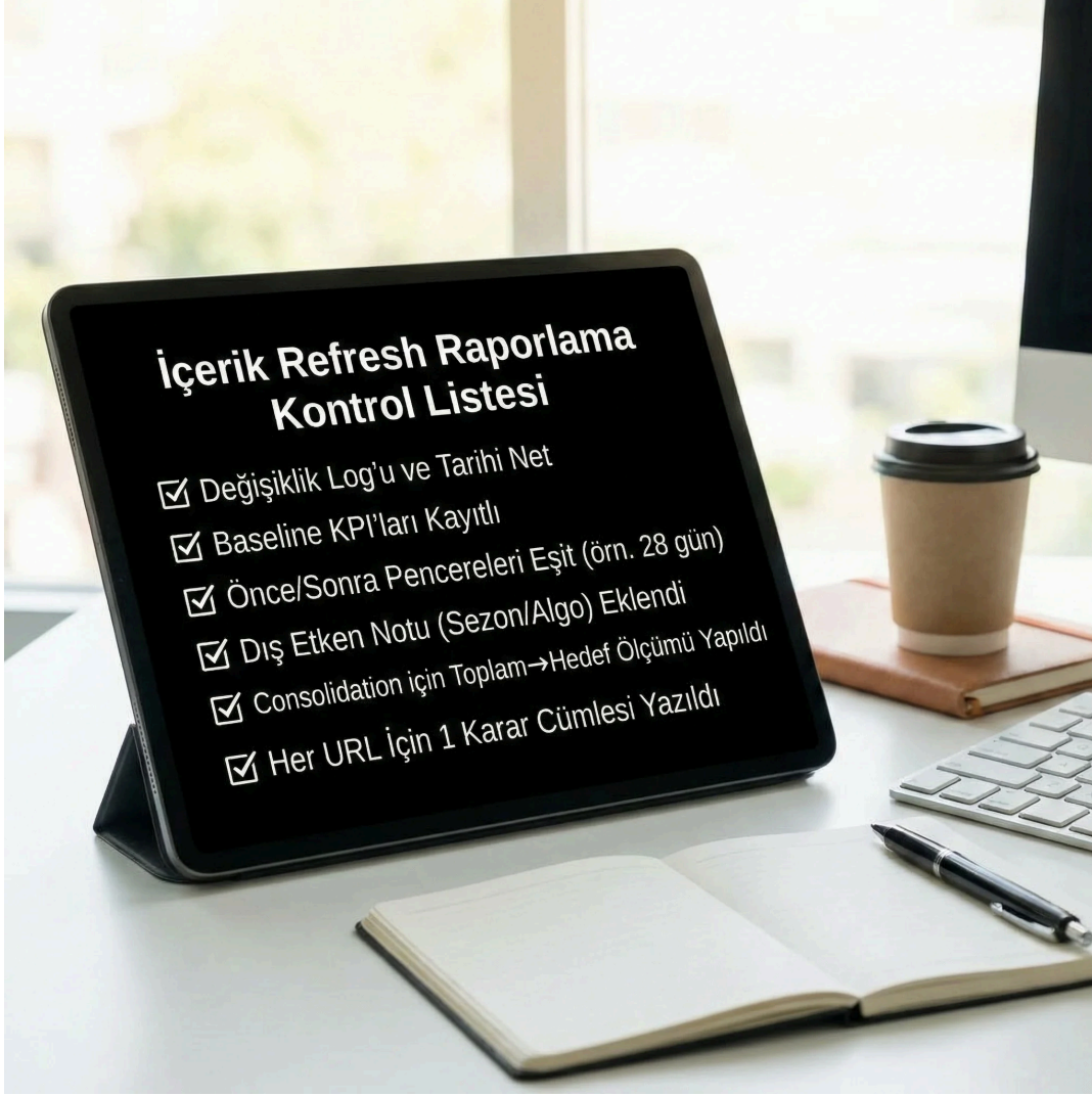
Refresh checklist, ekip bağlamı