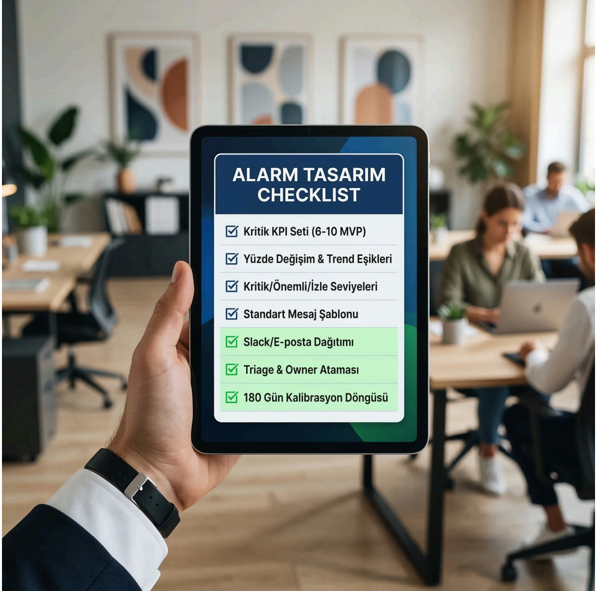
Alarm yorgunluğu ve eşik kontrol checklist'i, kurum bağlamı