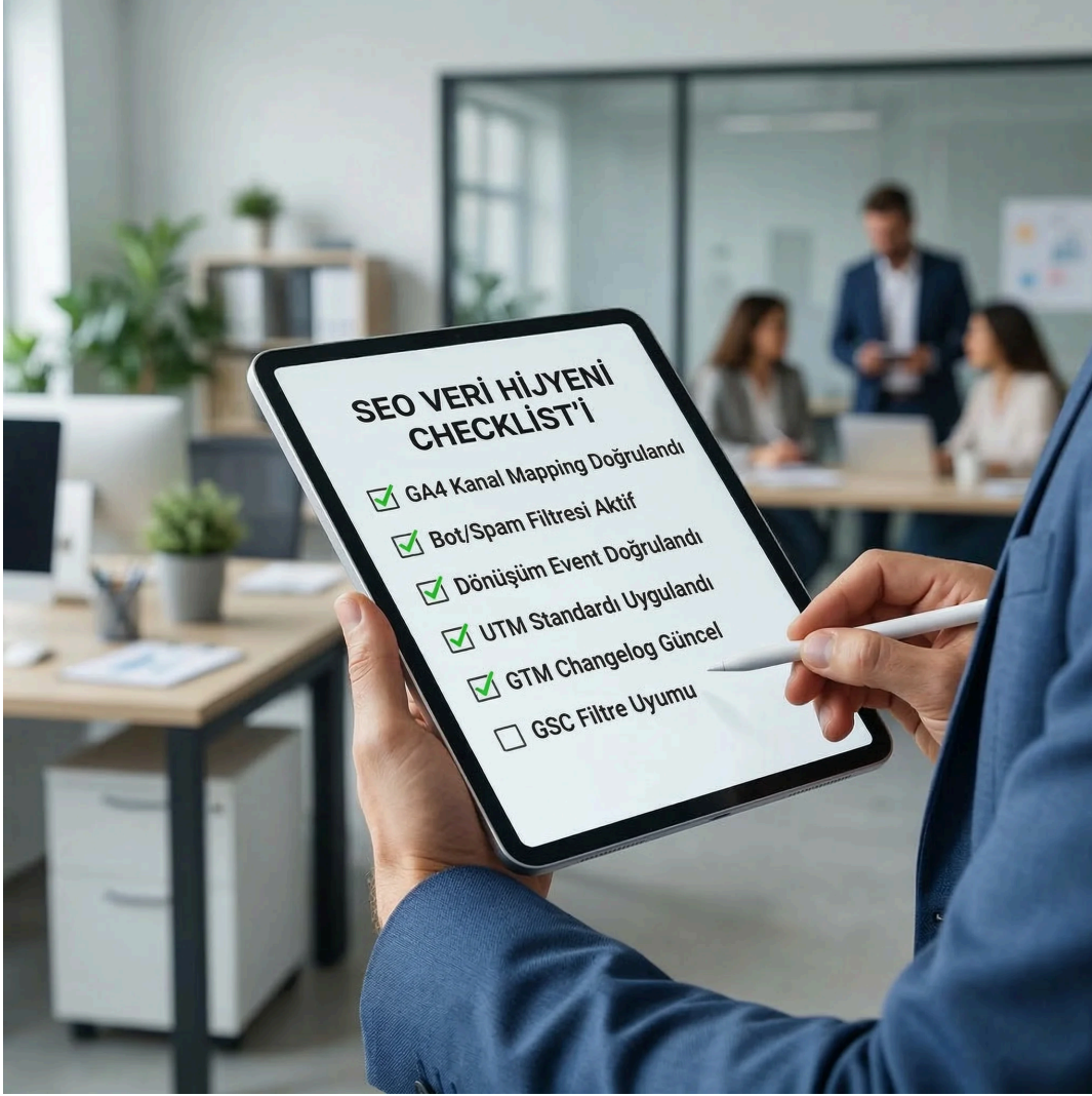
Hijyen checklist kartı, ekip bağlamı