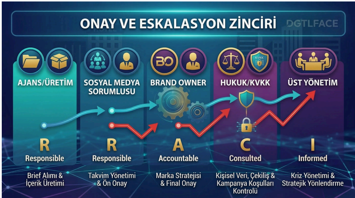
[Diagram] — Onay + Eskalasyon Akışı Diyagramı

Rutin bir içeriğin hızlı şeritten onaylanma süreci ile riskli bir içeriğin KVKK/Hukuk süzgecine girme ve olası bir kriz anında yönetim kademesine eskalasyon adımlarını gösteren çift hatlı süreç diyagramı