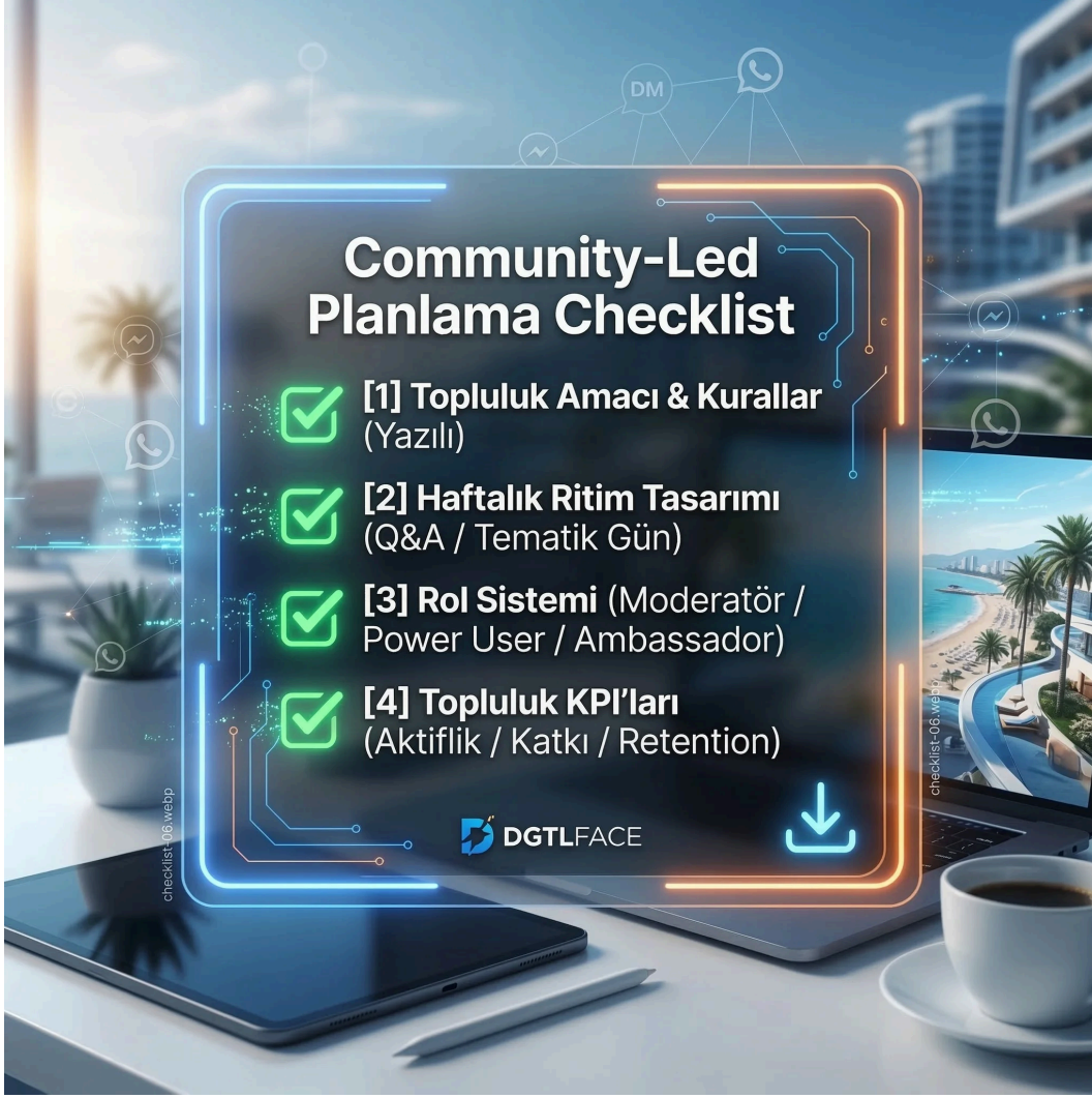
[Checklist Card] — Community-Led Planlama Checklist Kartı

Topluluk yöneticileri, sosyal medya ekipleri ve ajans koordinatörlerinin; topluluk ritimlerini kaçırmamak, KVKK sınırlarını ihlal etmemek ve roller arasındaki senkronizasyonu her hafta eksiksiz kontrol etmek için sürekli göz önünde bulundurabilecekleri kompakt kontrol kartı tasarımı