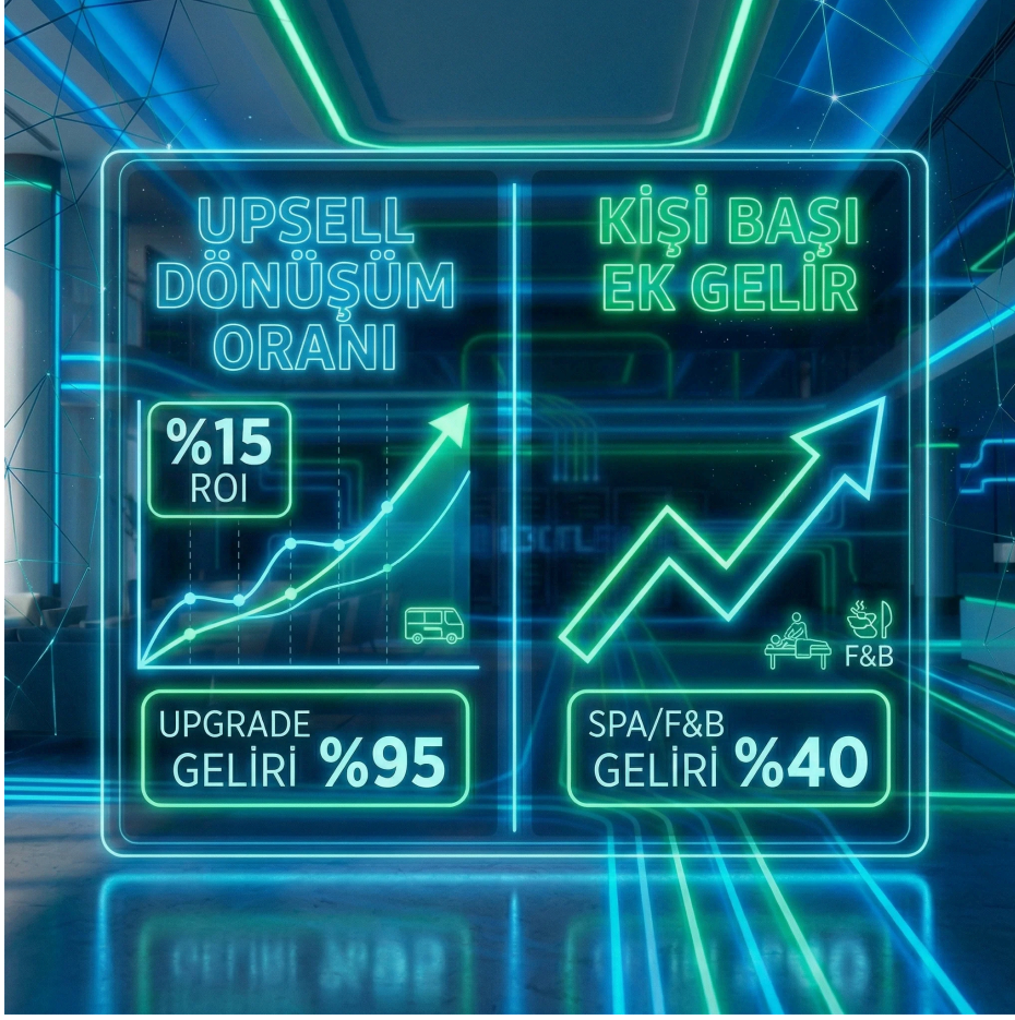
“Up-sell KPI kartı, dönüşüm ve ek gelir otel revenue bağlamı”