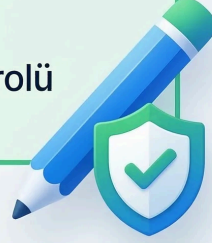
Checklist — “Yeni domain off-page kontrol kartı”