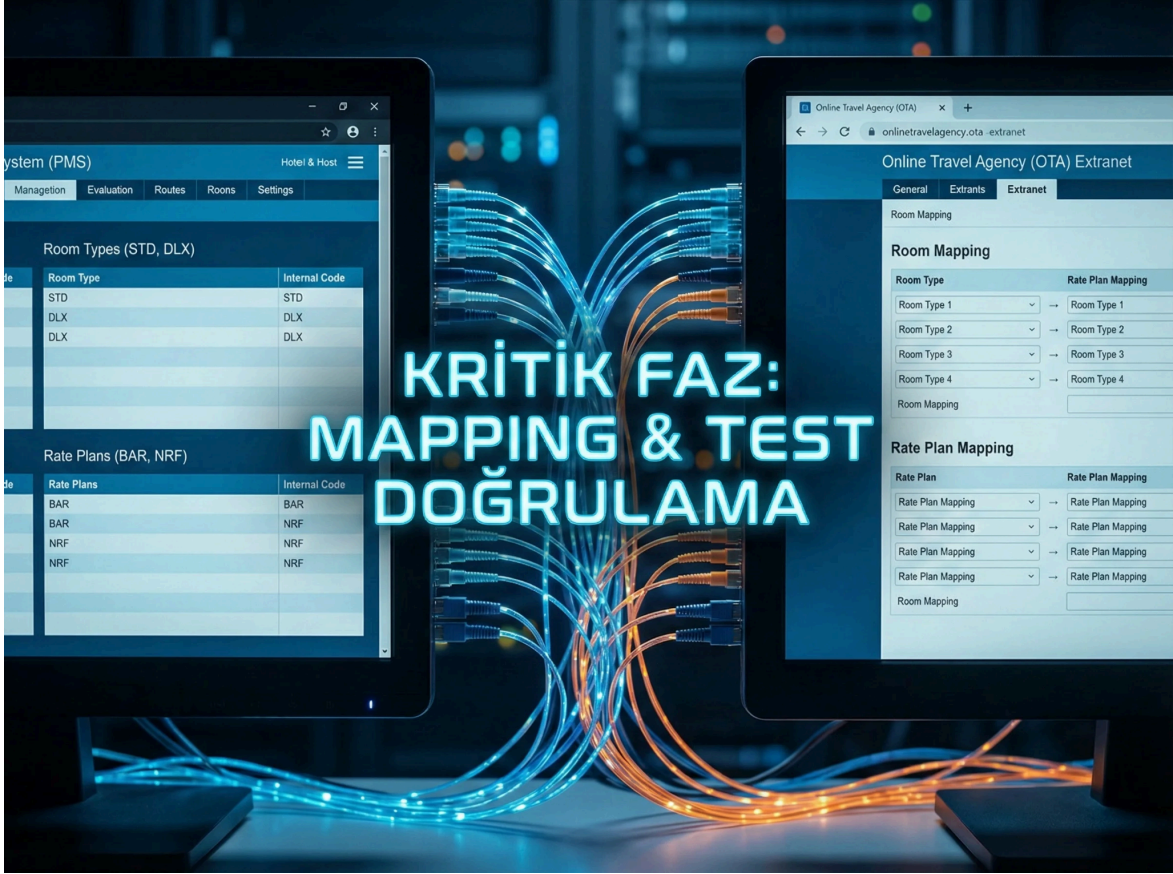
"Hatasız entegrasyon için Room ve Rate Mapping eşleştirme tablosu"