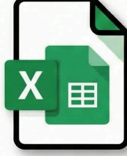
KPI Tanım & Hedef Tablosu (XLS)